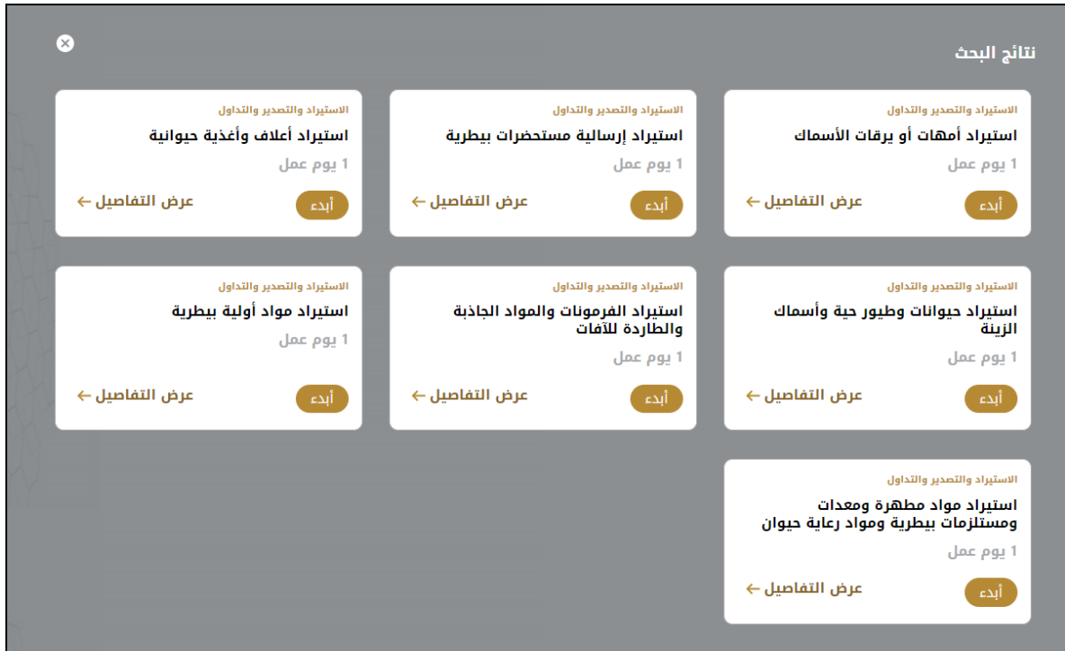
الشكل 18 - دليل الخدمة

1- من لوحة التحكم اضغط على طلب جديد ثم اختر طلب بيع بدن قارب صيد. ومن ثم اضغط على بدء طلب جديد.