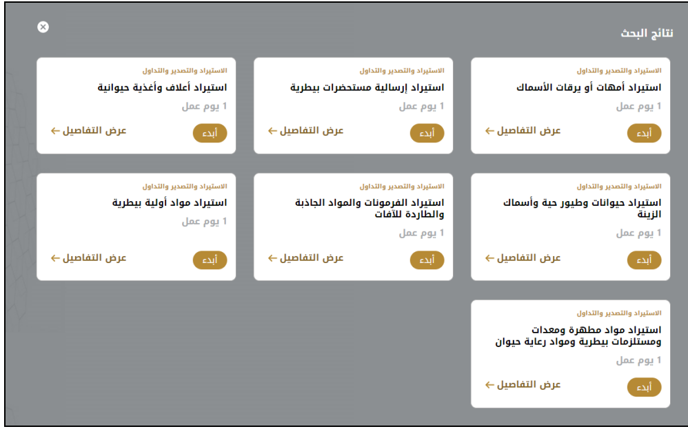
الشكل 18 - دليل الخدمة