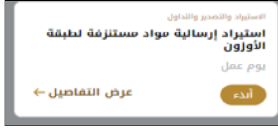
الشكل 11 - بطاقة الخدمة

3- انقر فوق أبدء لإبدء طلب الخدمة المحددة