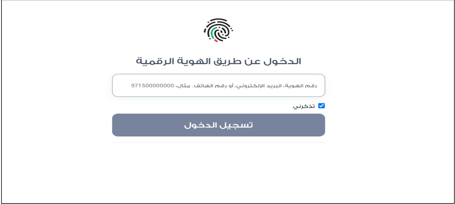
الشكل 2 - صفحة تسجيل الدخول

3- يرجى ادخال رقم الهوية او البريد الالكتروني او رقم الهاتف المسجل في الهوية الرقمية