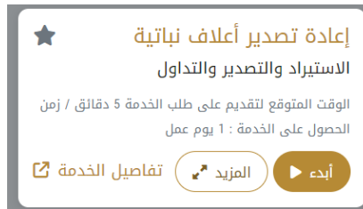
الشكل 11 - بطاقة الخدمة

3- انقر فوق ابدء لبدء طلب الخدمة المحددة