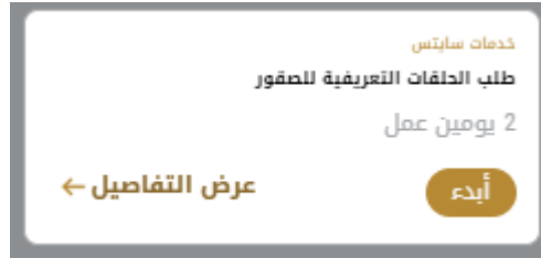
الشكل 11 - بطاقة الخدمة

تعرض كل بطاقة خدمة الفئة المدرجة تحتها واسم الخدمة، بالإضافة إلى الوقت اللازم لإكمال الطلب.