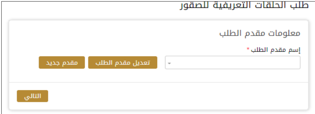
الشكل 19 - حدد اسم مقدم الطلب