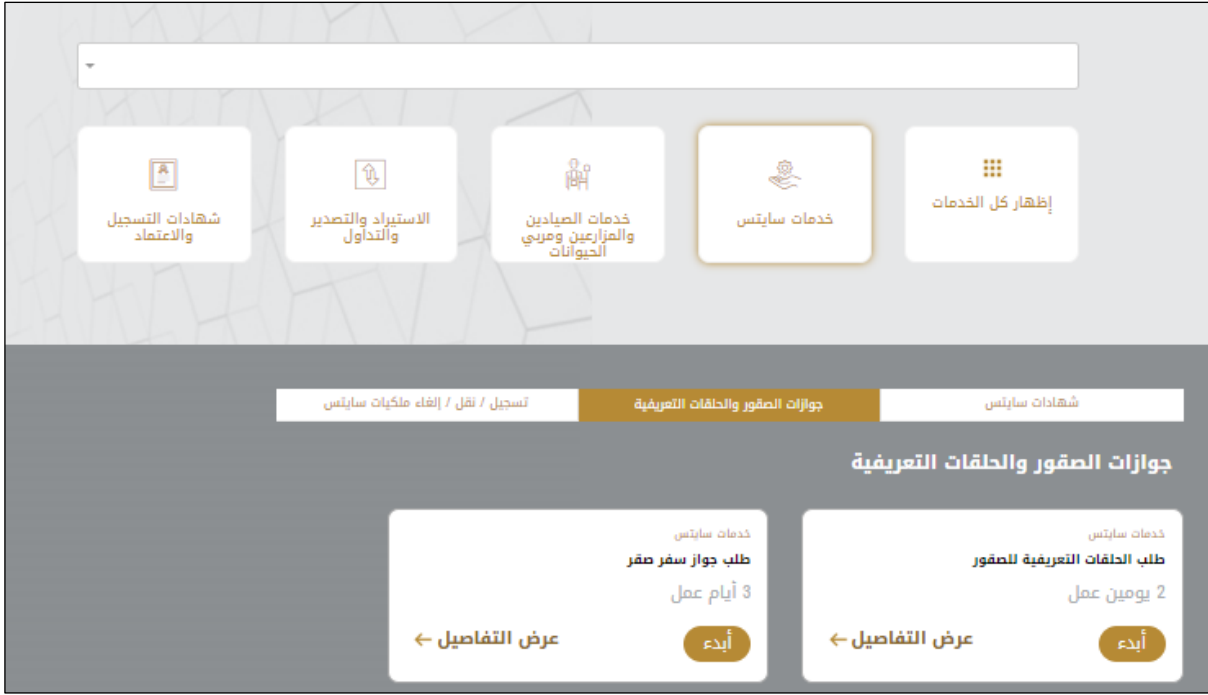
الشكل 10 - طلب خدمة جديد

1- لطلب خدمة رقمية جديدة، اضغط على طلب جديد زر طلب جديد، على لوحة القيادة. وسيتم عرض الشاشة التالية: