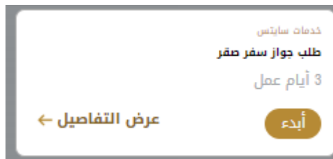
الشكل 11 - بطاقة الخدمة

تعرض كل بطاقة خدمة الفئة المدرجة تحتها واسم الخدمة، بالإضافة إلى الوقت اللازم لإكمال الطلب.