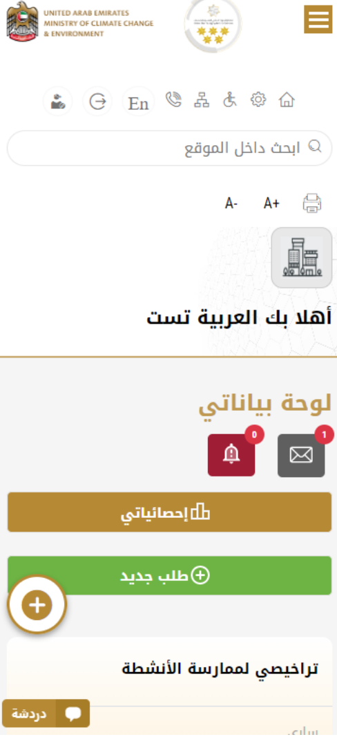
الشكل 7- لوحة التحكم الخاصة