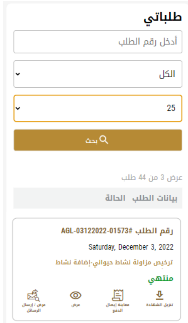
الشكل 2.3 - تنزيل الشهادة أو عرضها