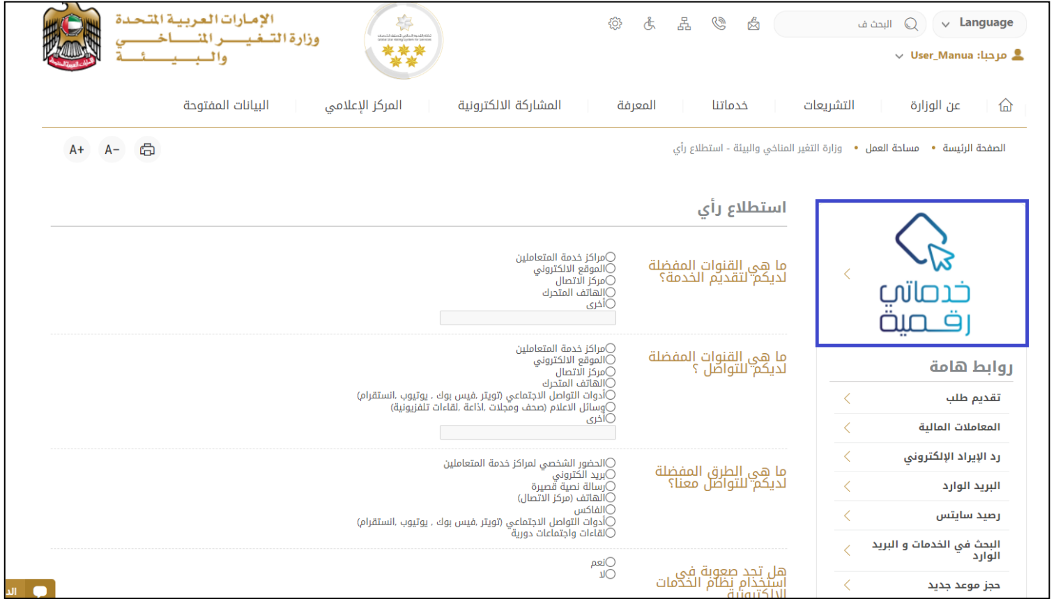
الشكل 6 - أيقونة "Go Digital"

يمكن الوصول إلى منصة الخدمات الرقمية داخليًا من الصفحة الرئيسية لوزارة التغير المناخي والبيئة من خلال النقر على أيقونة Go Digital الموجودة على يسار الصفحة الرئيسية