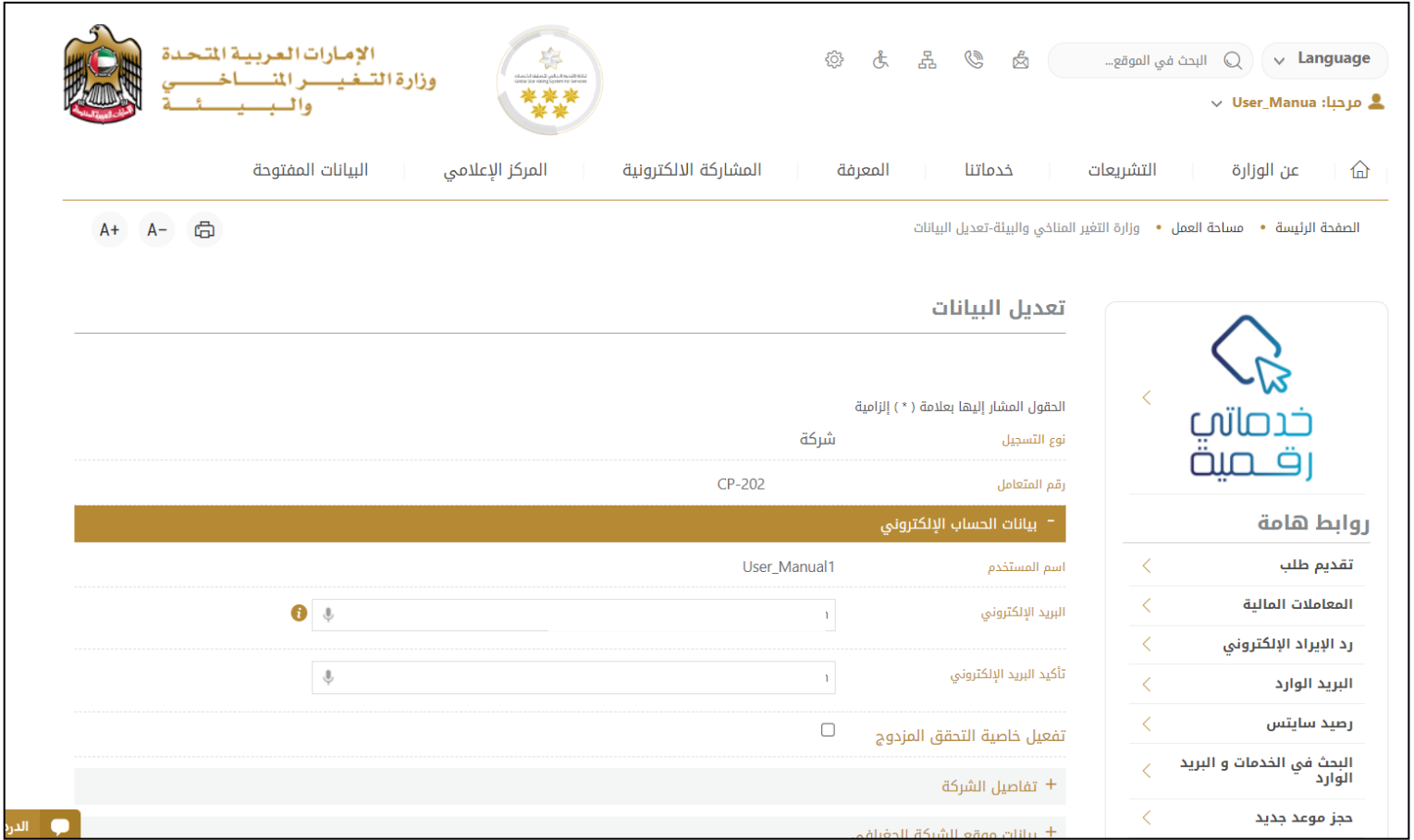
الشكل 5 - تعديل بيانات الحساب