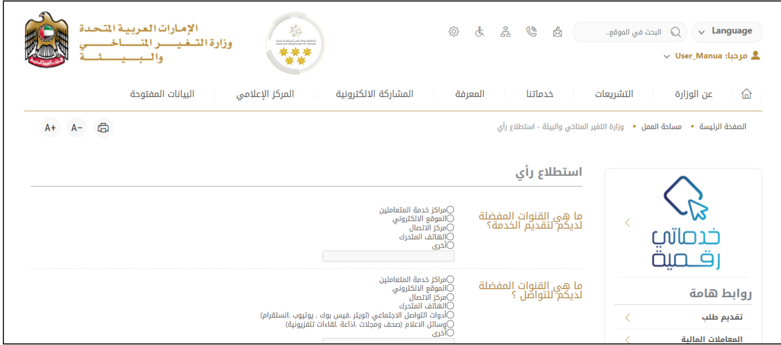
الشكل 3 - صفحة استطلاع الوزارة