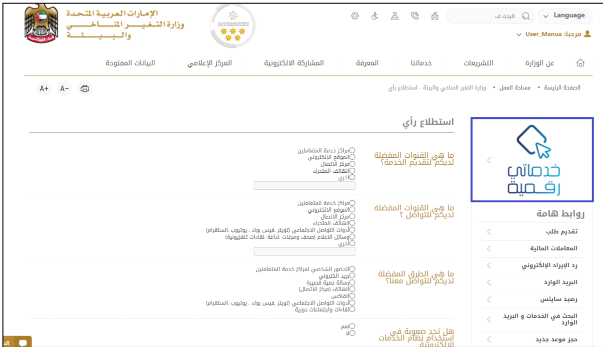
الشكل 6 - أيقونة "Go Digital"