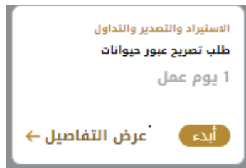
الشكل 11 - بطاقة الخدمة

تعرض كل بطاقة خدمة الفئة المدرجة تحتها واسم الخدمة، بالإضافة إلى الوقت اللازم لإكمال الطلب.