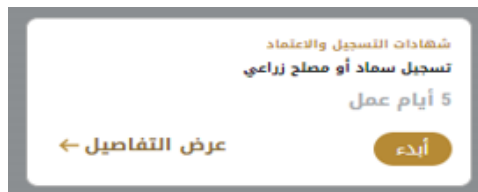
الشكل 11 - بطاقة الخدمة

3- انقر فوق أبدء ابدأ، لبدء طلب الخدمة المحددة