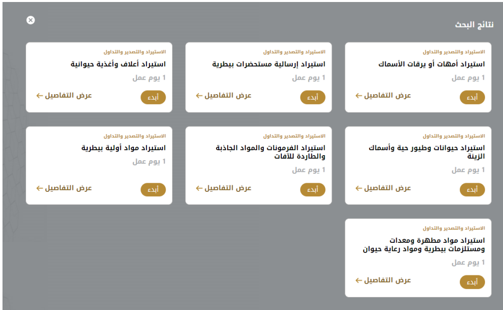
الشكل 18 - دليل الخدمة

1- من لوحة التحكم اضغط على طلب جديد ثم اختر طلب استيراد أعلاف وأغذية حيوانية. ومن ثم اضغط على بدء طلب جديد.