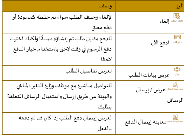
الجدول 2 - إجراءات طلب الخدمة

2- يمكنك اتخاذ أي من الإجراءات التالية بشأن الطلب المحدد: