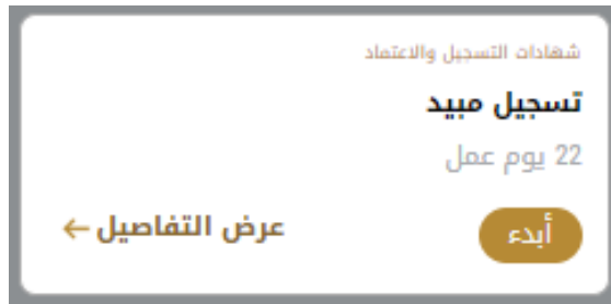
الشكل 11 - بطاقة الخدمة