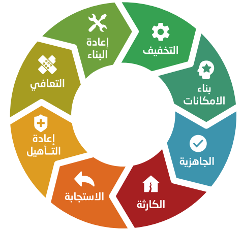
الشكل (1): دورة إدارة الكوارث الطبيعية