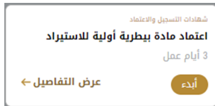
الشكل 11 - بطاقة الخدمة

تعرض كل بطاقة خدمة الفئة المدرجة تحتها واسم الخدمة، بالإضافة إلى الوقت اللازم لإكمال الطلب.