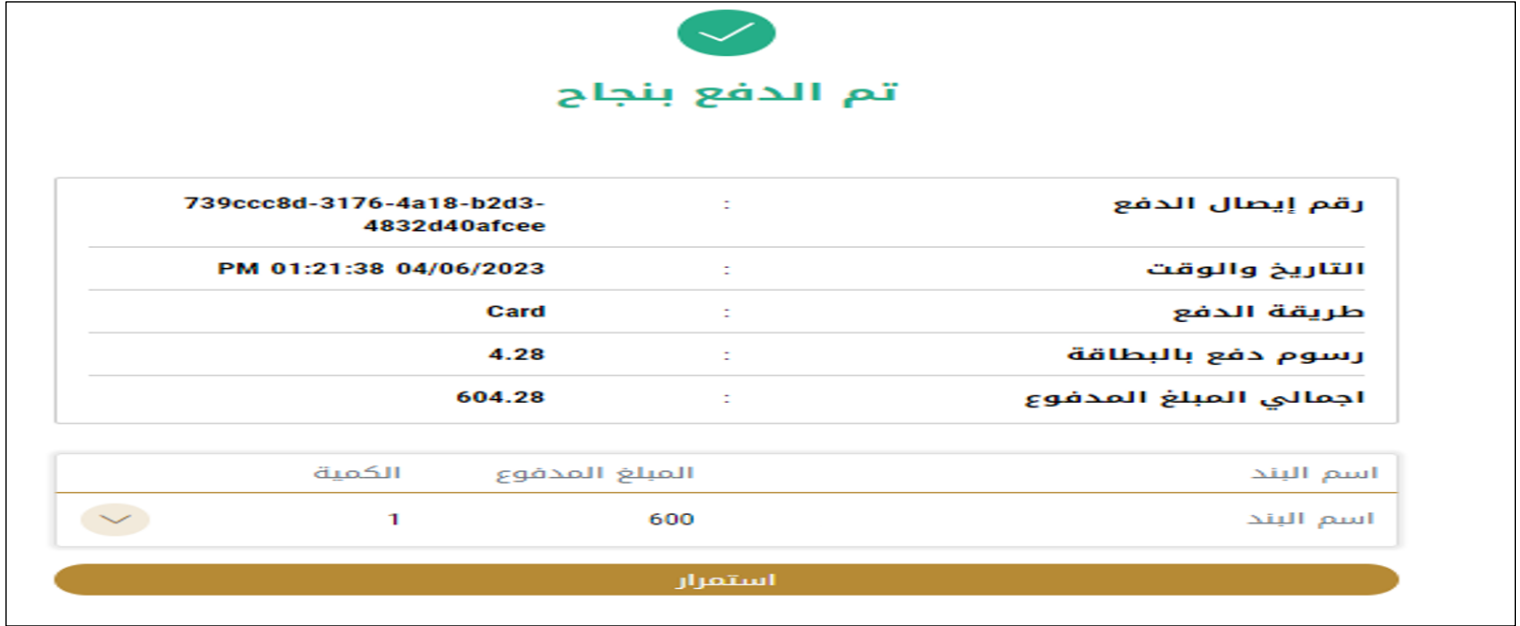
الشكل 15 - تأكيد الدفع

4. بمجرد إتمام الدفع ونجاحه، ستتلقي رسالة تأكيد، وستحول حالة طلب الخدمة إلى قيد المراجعة