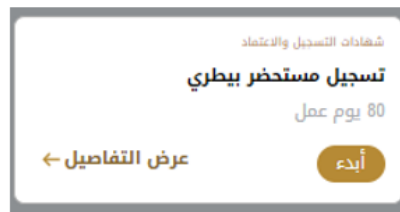
الشكل 11 - بطاقة الخدمة

تعرض كل بطاقة خدمة الفئة المندرجة تحتها واسم الخدمة، بالإضافة إلى الوقت اللازم لإكمال الطلب.