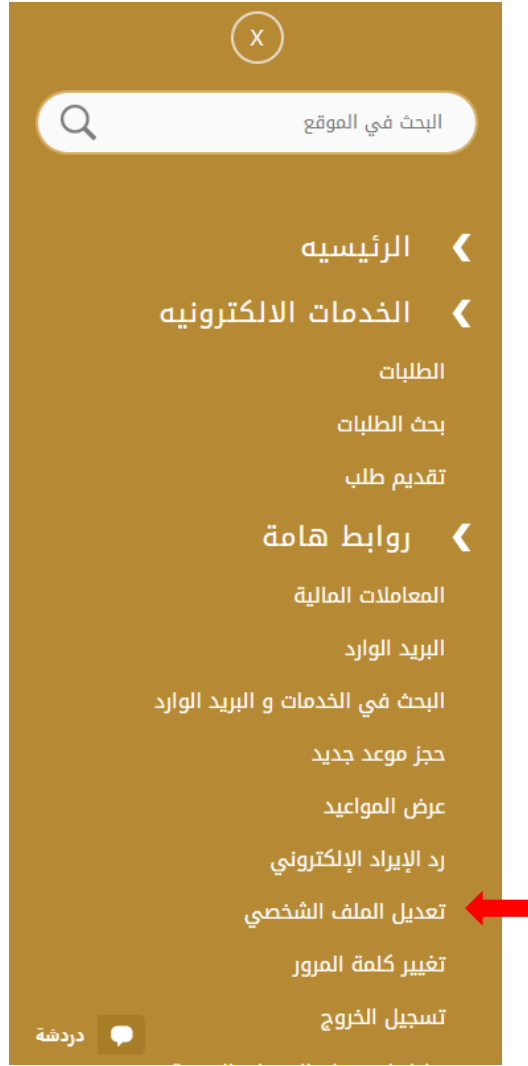
الشكل 4 - تحديث ملف تعريف الشركة

3- سيتم توجيهك إلى صفحة "تعديل البيانات" لتعديل تفاصيل الحساب الشخصي بالوزارة