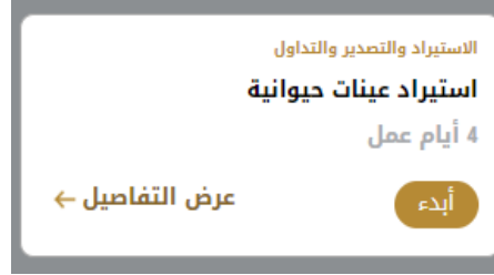
الشكل 11 - بطاقة الخدمة

3- انقر فوق ابدء لبدء طلب الخدمة المحددة