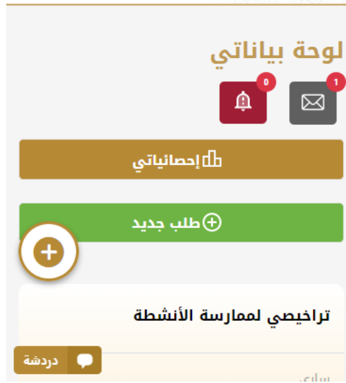
الشكل 7- لوحة التحكم الخاصة