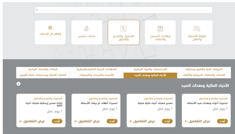
الشكل 18 - دليل الخدمة