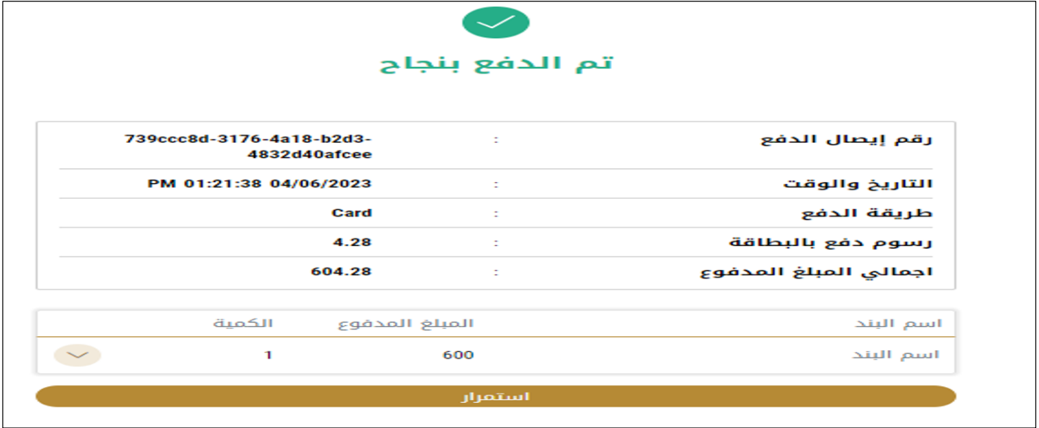
الشكل 15 - تأكيد الدفع

4. بمجرد إتمام الدفع ونجاحه، ستتلقى رسالة تأكيد، وستحول حالة طلب الخدمة إلى قيد المراجعة