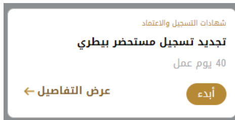
الشكل 11 - بطاقة الخدمة

تعرض كل بطاقة خدمة الفئة المندرجة تحتها واسم الخدمة، بالإضافة إلى الوقت اللازم لإكمال الطلب.