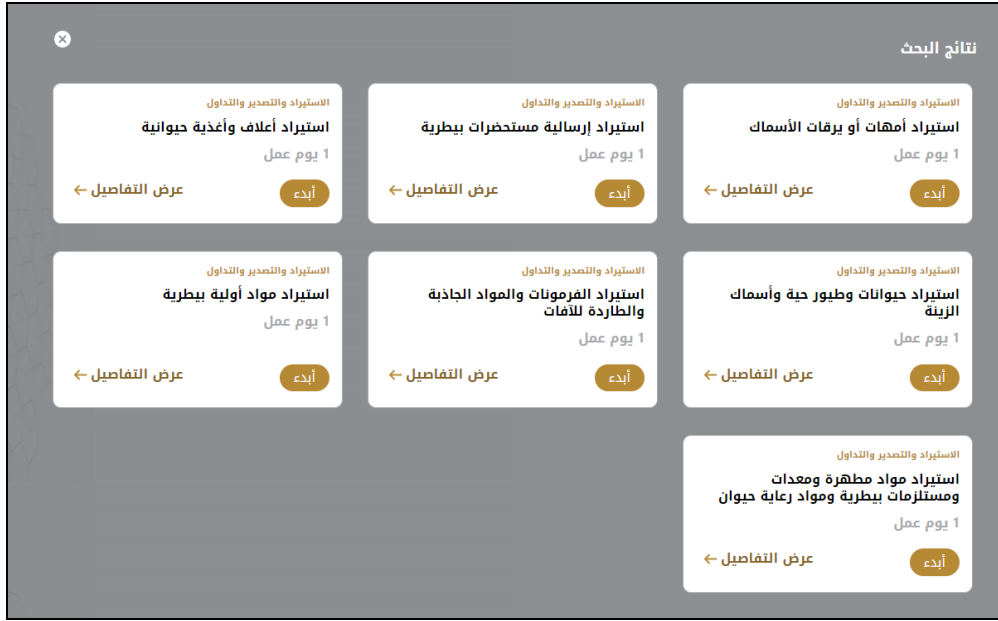
الشكل 18 - دليل الخدمة