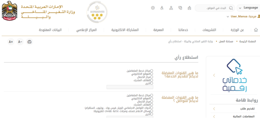
الشكل 3 - صفحة استطلاع الوزارة