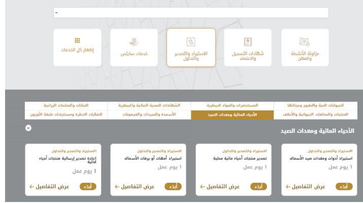
الشكل 10 - طلب خدمة جديد

1- لطلب خدمة رقمية جديدة، اضغط على طلب جديد زر طلب جديد، على لوحة القيادة. وسيتم عرض الشاشة التالية: