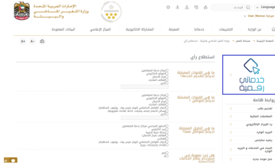
الشكل 6 - أيقونة "Go Digital"

يمكن الوصول إلى منصة الخدمات الرقمية داخليًا من الصفحة الرئيسية لوزارة التغير المناخي والبيئة من خلال النقر على أيقونة Go Digital الموجودة على يسار الصفحة الرئيسية