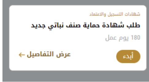
الشكل 11 - بطاقة الخدمة

تعرض كل بطاقة خدمة الفئة المندرجة تحتها واسم الخدمة، بالإضافة إلى الوقت اللازم لإكمال الطلب.