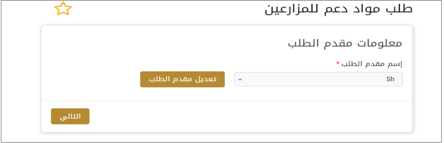
الشكل 19 - حدد اسم مقدم الطلب