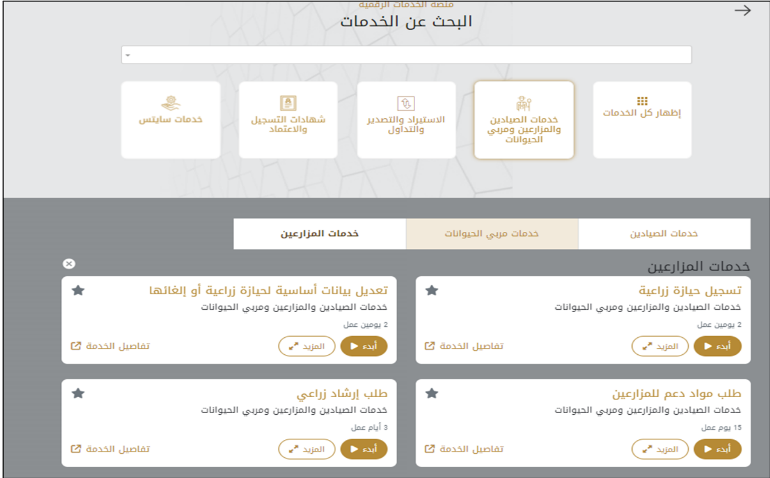
الشكل 10 - طلب خدمة جديد

2- اختر الخدمة المطلوبة عن طريق أحد الاختيارات الآتية: