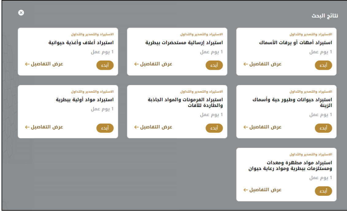
الشكل 10 - طلب خدمة جديد

1- لطلب خدمة رقمية جديدة، اضغط على طلب جديد زر طلب جديد، على لوحة القيادة. وسيتم عرض الشاشة التالية: