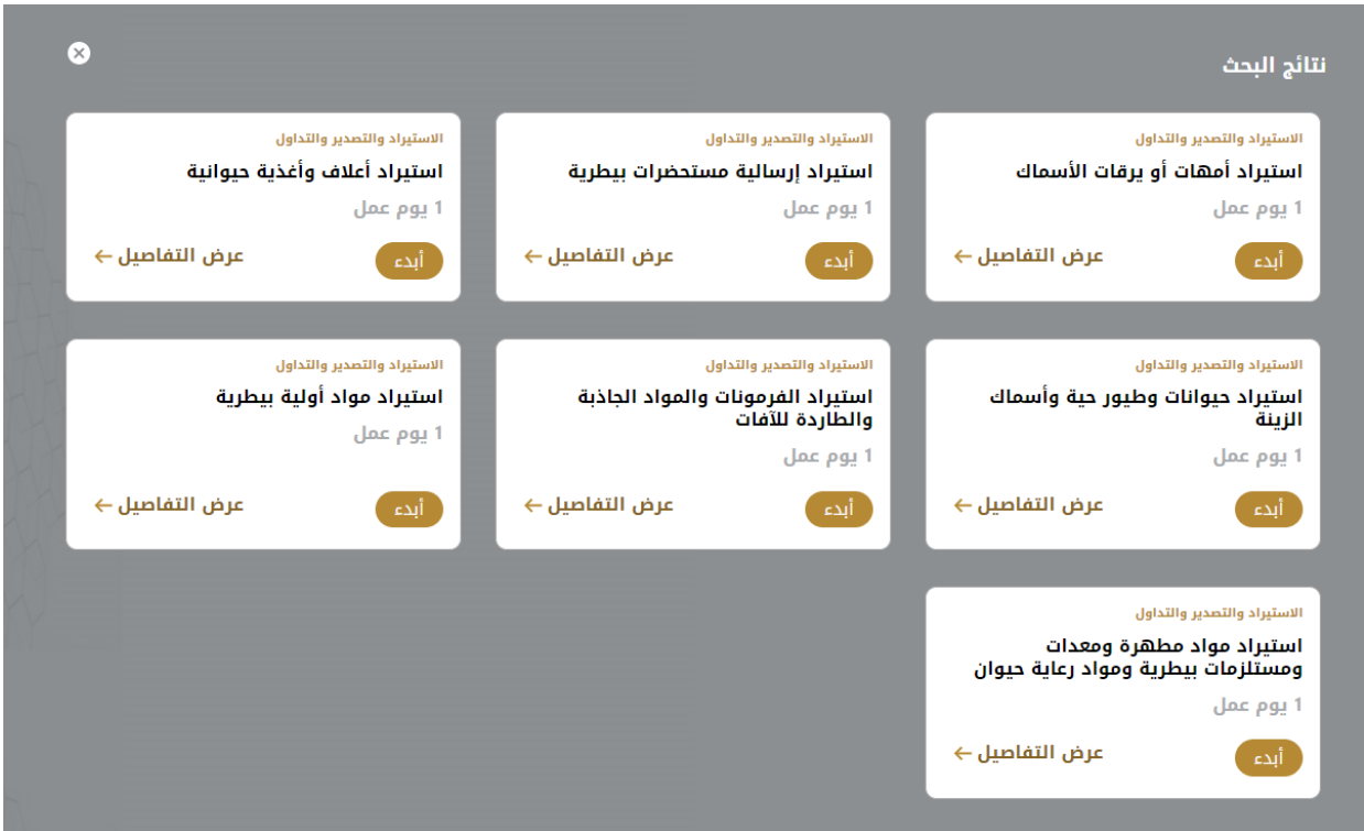
الشكل 18 - دليل الخدمة

1- من لوحة التحكم اضغط على طلب جديد ثم اختر طلب استيراد مواد أولية بيطرية . ومن ثم اضغط على بدء طلب جديد.