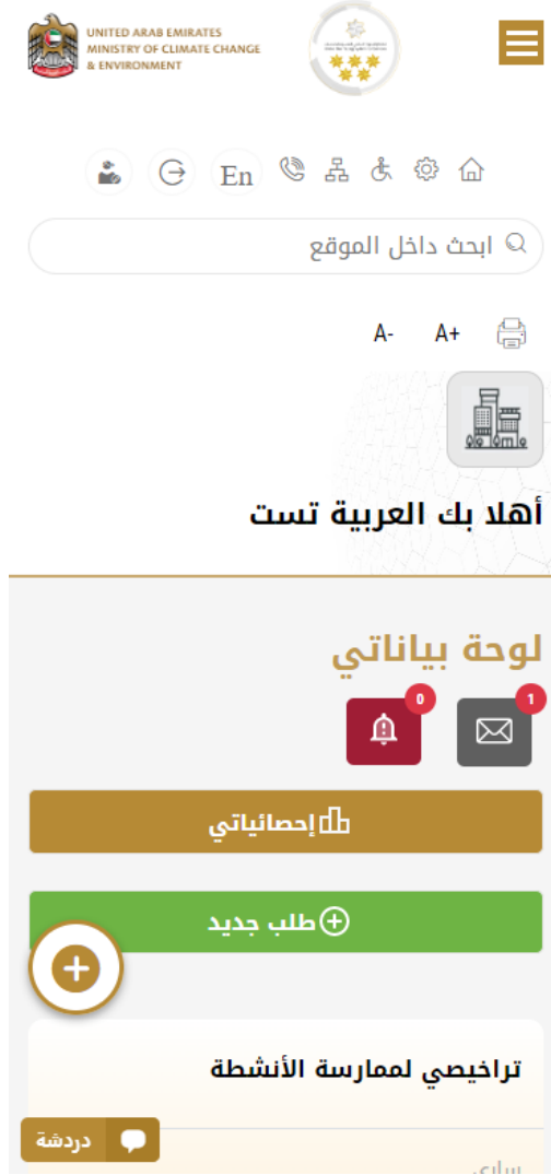
الشكل 7- لوحة التحكم الخاصة