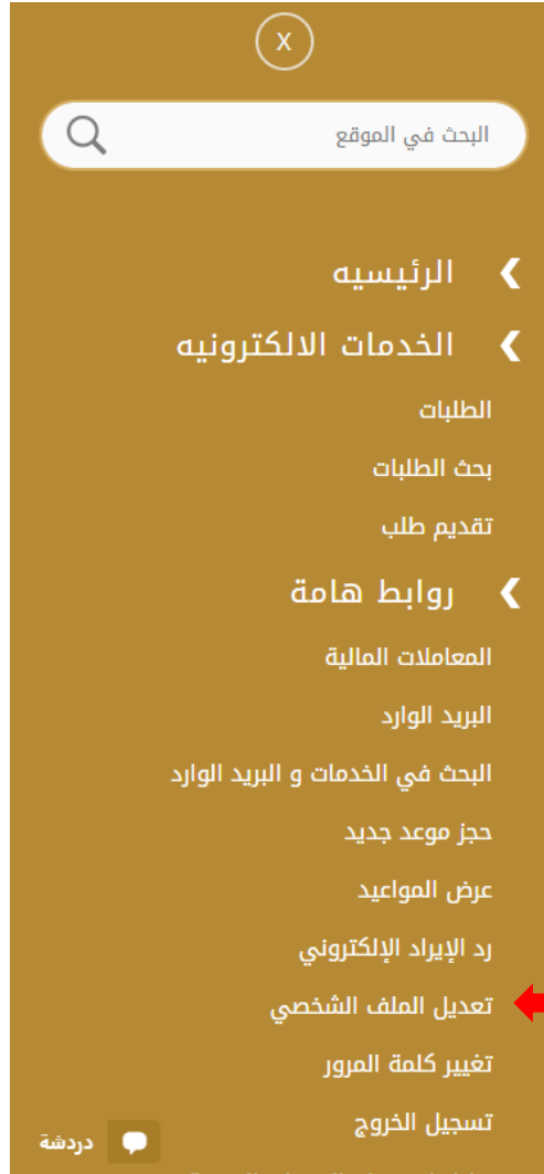
الشكل 4 - تحديث ملف تعريف الشركة

3- سيتم توجيهك إلى صفحة "تعديل البيانات" لتعديل تفاصيل الحساب الشخصي بالوزارة