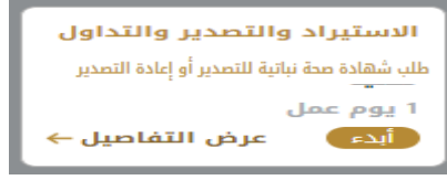
الشكل 11 - بطاقة الخدمة

3- انقر فوق أداء ابدأ، لبدء طلب الخدمة المحددة