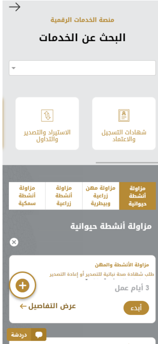
الشكل 10 - طلب خدمة جديد

1- لطلب خدمة رقمية جديدة، اضغط على طلب جديد زر طلب جديد، على لوحة القيادة. وسيتم عرض الشاشة التالية: