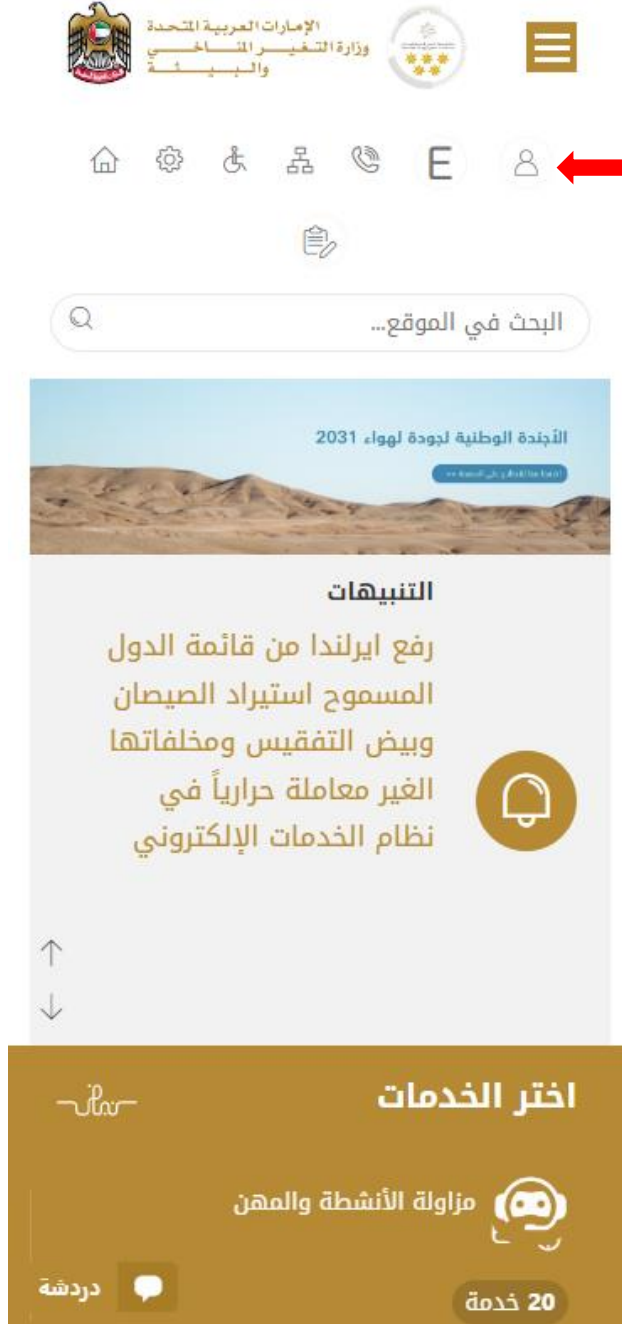
الشكل 1 - الصفحة الرئيسية لموقع الوزارة